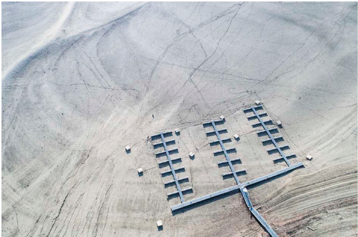
Lac de la Gruyère, Le Bry, 2018

Fraîchement diplômé, il est engagé comme photographe au journal La Gruyère en automne 2016. Il immortalise depuis lors le quotidien de cette région et de ses habitants. Il est notamment sensible aux traditions et à leurs impacts dans la création d'une identité commune gruérienne et apprécie tout particulièrement les images réalisées sur le vif, au cœur de l'action.