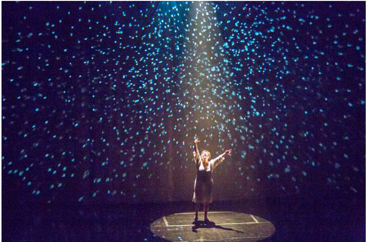
« Les divagations concertées de la baguette », Céline Césa, La Tour-de-Trême, Salle CO2, novembre 2016