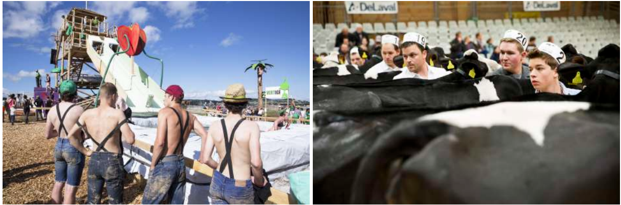
Fête des jeunesses gruériennes, La tête à l'an vert, Sâles, juillet 2016 Exposition nationale de Holstein et Red Holstein, Bulle, Espace Gruyère, mars 2015