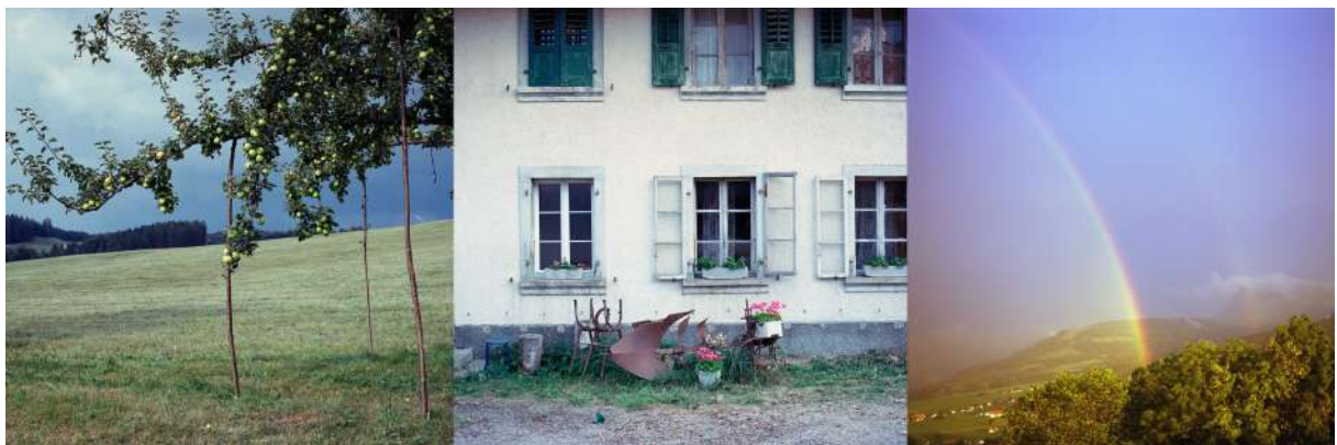
© Mélanie Rouiller, Campagne gruérienne (Bassin de la Sionge), argentine Trop chargé, 2018 / Décoration, 2018 / Ciel romantique, 2017