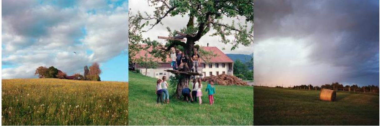
© Mélanie Rouiller, Campagne gruérienne (Bassin de la Sionge), argentine La ferme sur la colline, 2015 / L'anniversaire, 2016 / Coucher du soleil, 2015