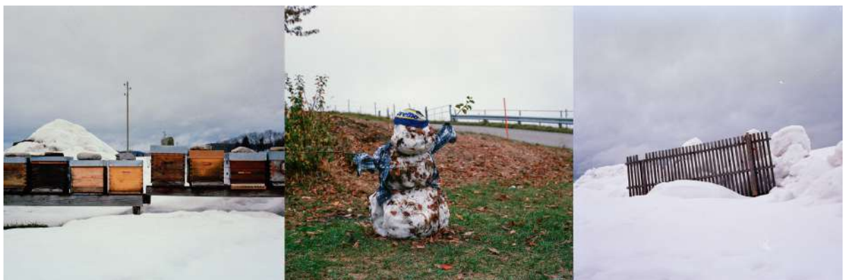
© Mélanie Rouiller, Campagne gruérienne (Bassin de la Sionge), argentique Les ruches, 2016 / La fin de l'hiver, 2019 / Structure hivernale, 2016

Pour son travail artistique, elle adopte la photographie et la vidéo comme supports de prédilection. En 2018, elle a reçu la bourse de mobilité pour la création artistique de l'État de Fribourg.